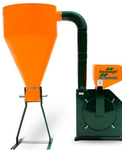
TRITURADOR DE MILHO COM SILO 1 TON / HR