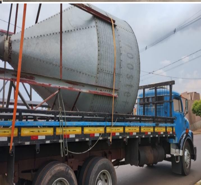
RECÉM ADQUIRIDA, PREVISTA PARA CHEGAR SEGUNDA SEMANA DE DEZEMBRO.