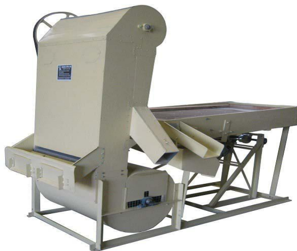
MOINHO MARTELO 1,5 A 2 TON / HR